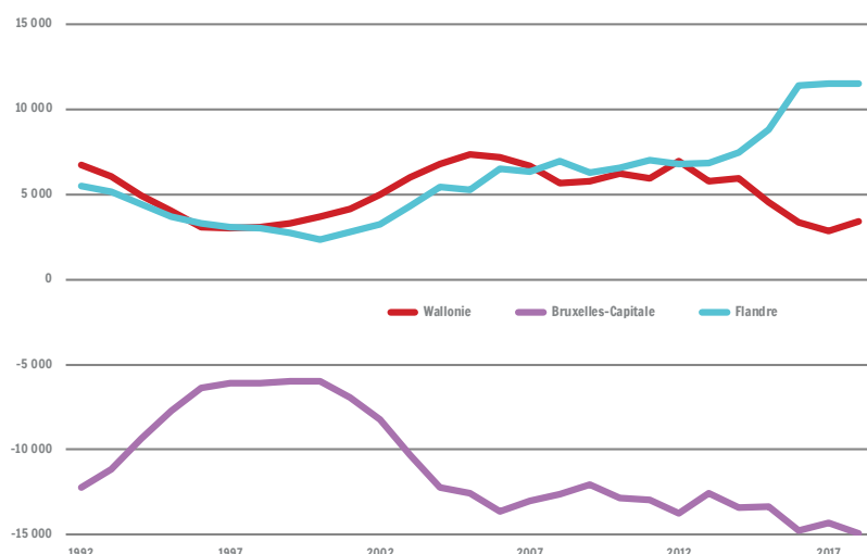
Solde des migrations internes dans les régions (1992-2016)

Depuis 2003, 5 000 à 7 000 personnes en plus sont venues chaque année s'installer en Wallonie (différence entre les entrées et les sorties en provenance ou à destination des deux autres régions). Ce nombre s'est réduit depuis quatre ans autour de 3 000 personnes. Pour la Flandre, en 2018, au solde positif de migration interne vis-à-vis de la Wallonie depuis 2016 s'ajoute un solde élevé envers Bruxelles. C'est Bruxelles-Capitale qui perd chaque année de la population au profit des deux autres régions, bénéficiant elle-même d'un apport important de population extérieure à la Belgique. Après avoir augmenté entre 2000 et 2003, ce solde annuel négatif s'était stabilisé autour de -13 000 personnes, avant d'approcher, depuis 2016, -15 000 personnes.