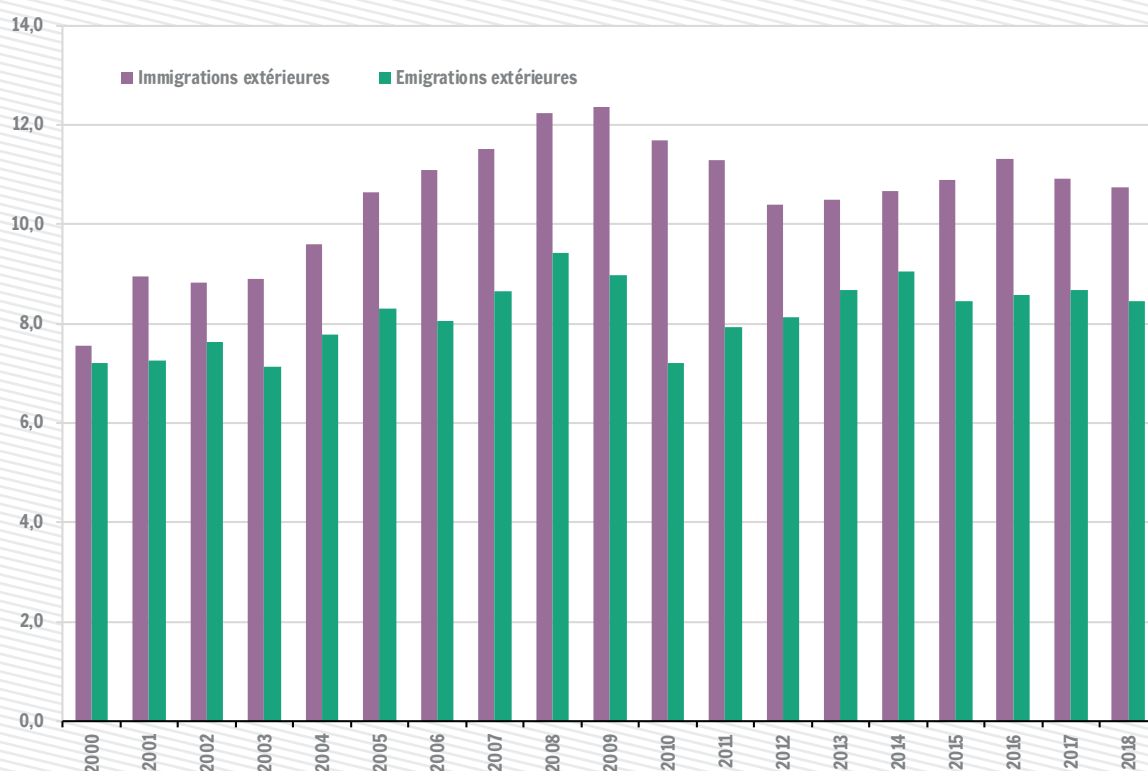
Migrations extérieures en Wallonie pour mille habitants (sans l'ajustement statistique)