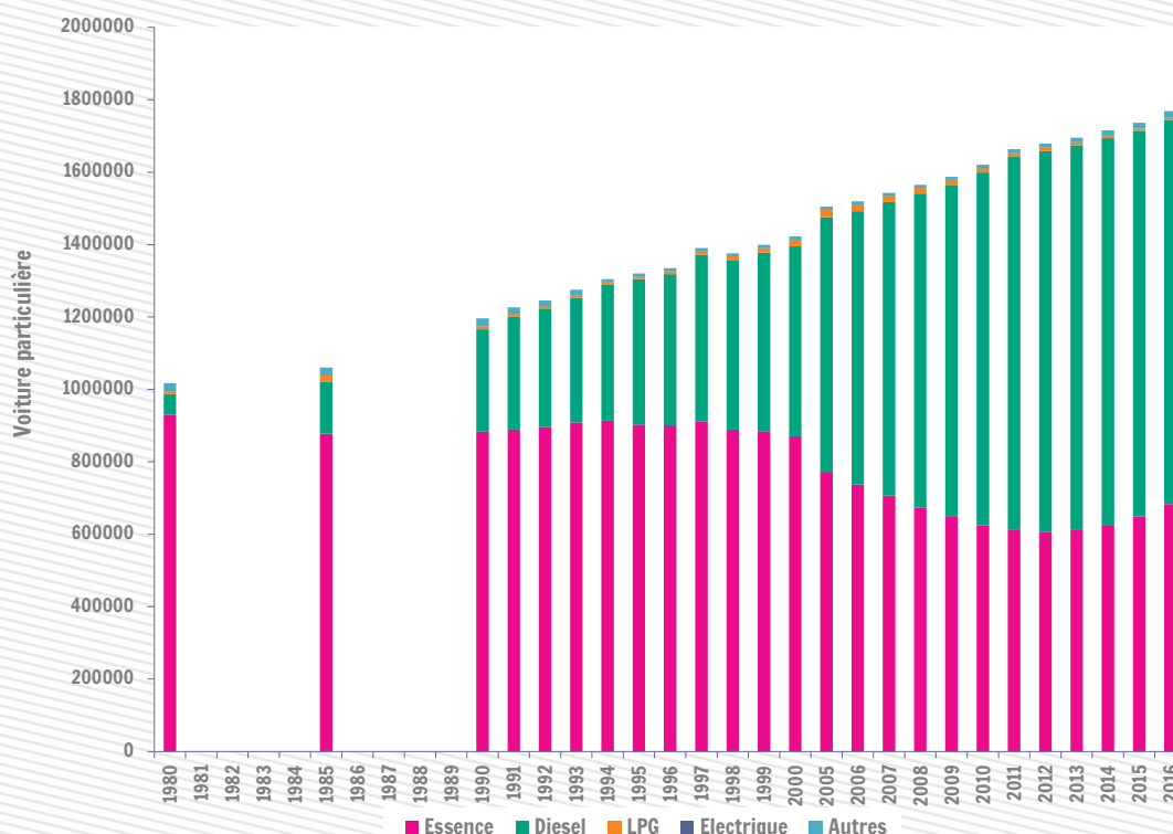
Evolution du parc automobile des voitures particulières en Wallonie et par type de motorisation