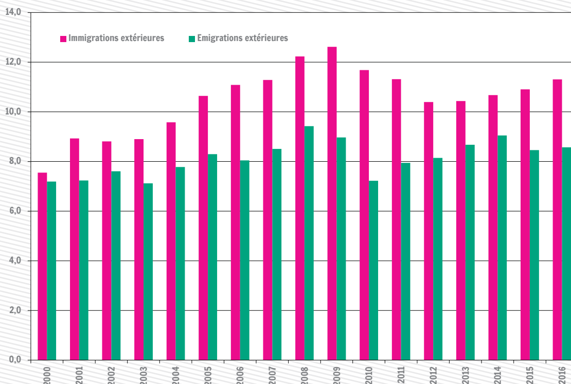
Migrations extérieures en Wallonie pour mille habitants

Sources : SPF-Economie / Direction générale Statistiques ; Calculs : IWEPS