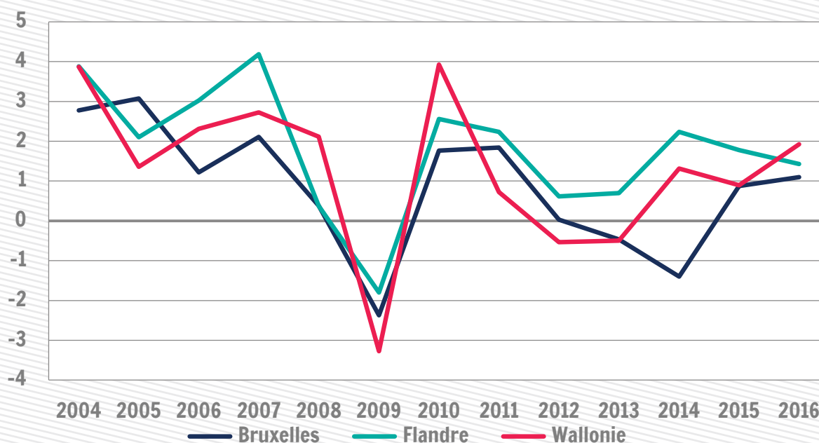
Taux de croissance du PIB en volume (en %)