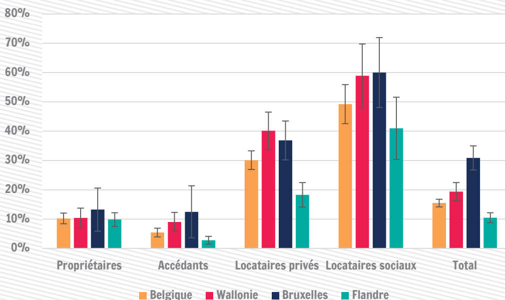
Taux de pauvreté selon le statut du logement

Sources : SILC 2016 (revenus 2015) ; Calculs : IWEPS