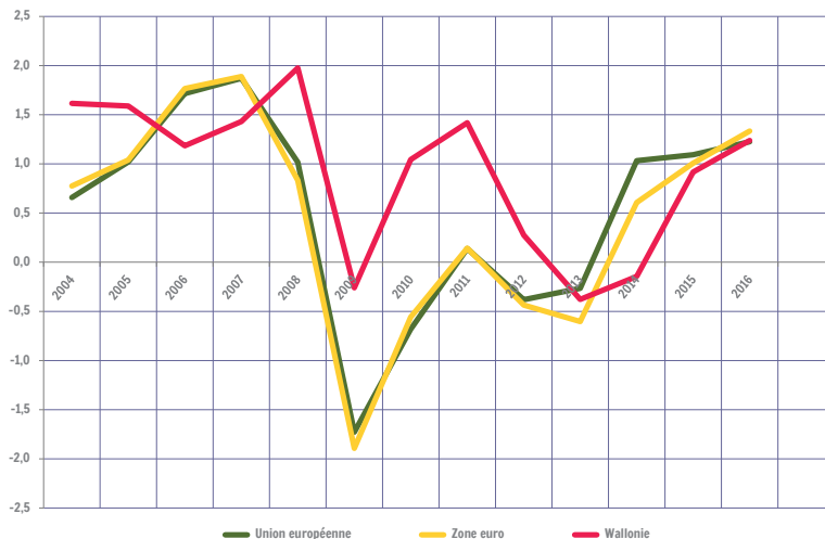
Taux de croissance annuel de l'emploi intérieur. Comparaison Wallonie / Europe

Entre 2003 et 2016, l'emploi intérieur wallon a augmenté à un rythme un peu moindre que l'emploi intérieur flamand (taux de croissance annuel moyen de +0,9 % pour la Wallonie et +1,0 % pour la Flandre) et à un rythme légèrement supérieur à celui de l'emploi intérieur allemand (+0,8 %). Durant cette période, il a crû à un rythme supérieur à la moyenne européenne (+0,5 %) ou de la zone euro (+0,4 %) ou encore de l'emploi intérieur chez nos voisins français (+0,4 %) et néerlandais (+0,5 %).