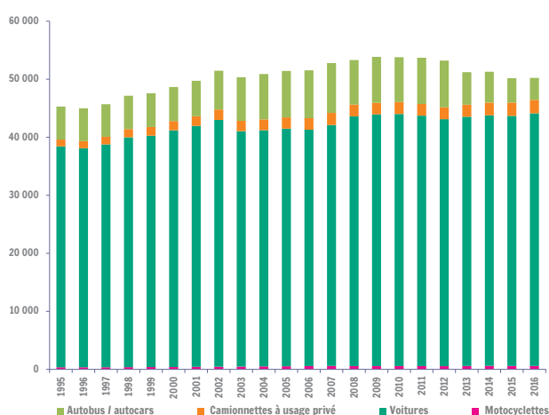
Nombre de voyageurs.km par an (millions de voy.km) par type de véhicule

La Wallonie comptait près de 46,5 milliards de voyageurs.km parcourus effectués à titre de transport privé sur le réseau wallon en 2016, à savoir celui réalisé par les motos, voitures particulières et camionnettes (usage privé). Le chiffre belge est d'un peu plus de 113 milliards.