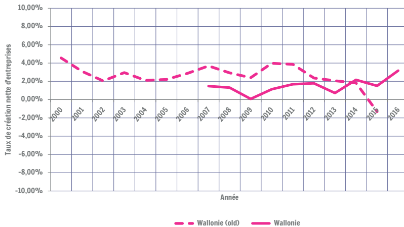
Taux de de création nette en Wallonie - Comparaison des deux méthodes

Sources : Base de données B-Information (old), Stabel ; Calculs : IWEPS