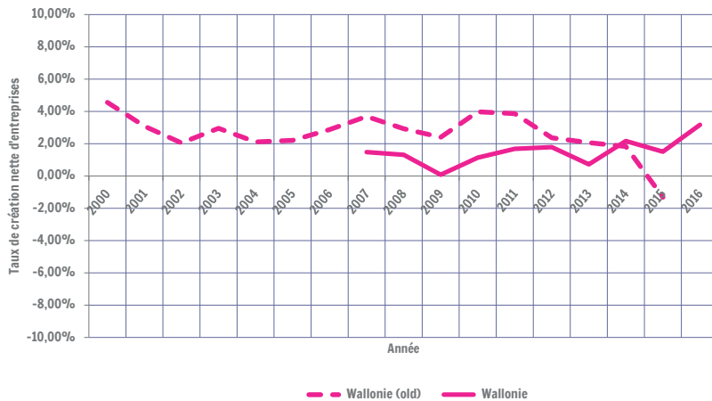
Taux de de création nette en Wallonie - Comparaison des deux méthodes

Sources : Base de données B-Information (old), Stabel ; Calculs : IWEPS