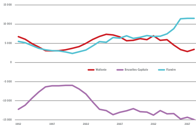
Solde des migrations internes dans les régions (1992-2016)

Depuis 2003, 5 000 à 7 000 personnes en plus sont venues chaque année s'installer en Wallonie (différence entre les entrées et les sorties en provenance ou à destination des deux autres régions). Ce nombre s'est réduit depuis quatre ans autour de 3 000 personnes. Pour la Flandre, en 2018, au solde positif de migration interne vis-à-vis de la Wallonie depuis 2016 s'ajoute un solde élevé envers Bruxelles. C'est Bruxelles-Capitale qui perd chaque année de la population au profit des deux autres régions, bénéficiant elle-même d'un apport important de population extérieure à la Belgique. Après avoir augmenté entre 2000 et 2003, ce solde annuel négatif s'était stabilisé autour de -13 000 personnes, avant d'approcher, depuis 2016, -15 000 personnes.