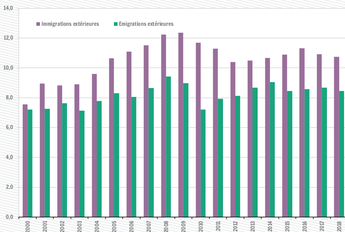
Migrations extérieures en Wallonie pour mille habitants (sans l'ajustement statistique)