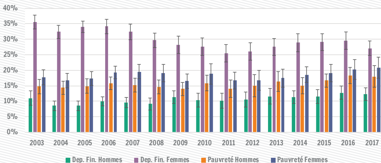
Taux de dépendance financière et de risque de pauvreté selon le sexe des personnes âgées d'au moins 25 ans en Wallonie

Sur base des revenus 2017, on estime que 27 % des femmes de 25 ans et plus ont un revenu sous le seuil de dépendance financière