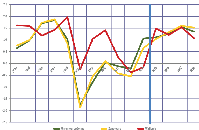
Taux de croissance annuel de l'emploi intérieur. Comparaison Wallonie / Europe

Entre 2015 et 2018, l'emploi intérieur wallon a augmenté à un rythme légèrement inférieur à celui de l'emploi intérieur de l'Union européenne (1,4 %) et de la zone euro (+1,5 %). Durant cette période, il a crû à un rythme supérieur à l'emploi intérieur français (+0,9 %), au même rythme que l'emploi intérieur allemand (+1,3 %) et à un rythme inférieur à l'emploi intérieur des Pays-Bas (+2,1 %).