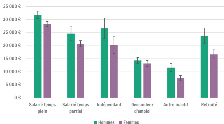
Revenu personnel moyen selon le statut par rapport au marché du travail

Les revenus personnels varient selon les statuts déclarés. Les travailleurs à temps plein ont des revenus plus élevés, contrairement aux demandeurs d'emploi et autres inactifs pour lesquels les revenus sont nettement plus faibles. Les écarts de revenus entre femmes et hommes varient aussi selon les catégories. Ils sont très importants chez les retraités et les autres inactifs. La majorité des femmes catégorisées comme autres inactifs se déclarent au foyer, alors que les hommes de cette catégorie sont majoritairement en incapacité de travail. Les faibles écarts chez les demandeurs d'emploi s'expliquent par un nombre important de mères seules bénéficiant d'une allocation majorée pour chef de ménage, alors que les hommes seuls avec enfants se déclarant demandeurs d'emploi sont peu nombreux.