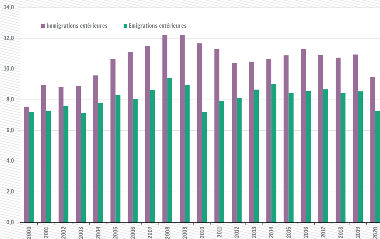
Migrations extérieures en Wallonie pour mille habitants (sans l'ajustement statistique)

Sources : Demobel - Statbel Registre national ; Calculs : IWEPS