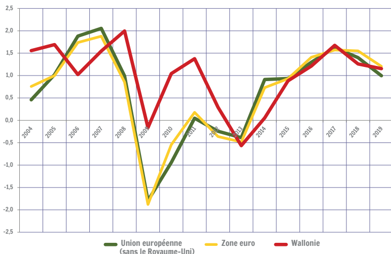
Taux de croissance annuel de l'emploi intérieur. Comparaison Wallonie / Europe (Union européenne : sans le Royaume-Uni)

Entre 2009 et 2019, l'emploi intérieur wallon a augmenté (+0,8 %) à un rythme légèrement supérieur à celui de l'emploi intérieur de l'Union européenne (+0,6 %) et de la zone euro (+0,6 %). Durant cette période, il a crû à un rythme supérieur à l'emploi intérieur français (+0,6 %), au même rythme que l'emploi intérieur des Pays-Bas (+0,8 %) et à un rythme inférieur à l'emploi intérieur allemand (+1,0 %).