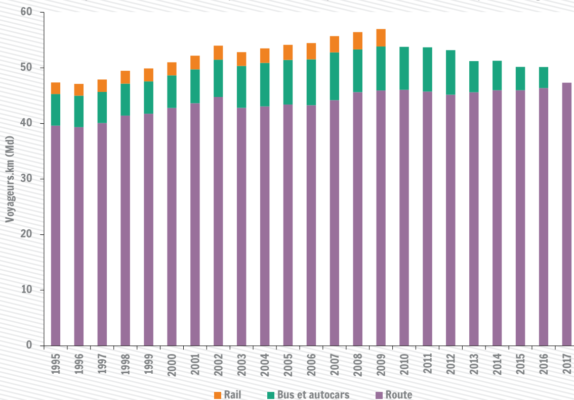
Evolution et répartition modale du transport terrestre de personnes en Wallonie (en pourcentage)