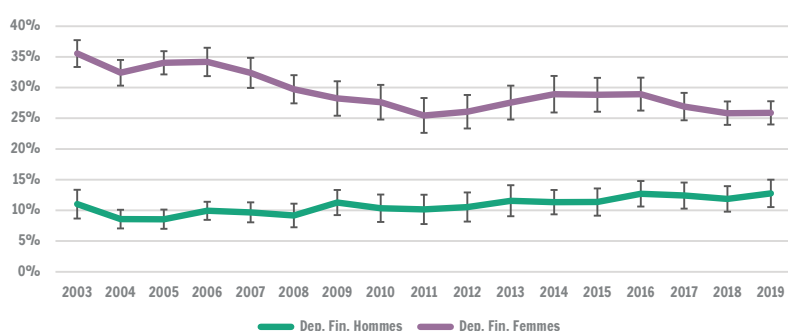
Evolution des taux de dépendance financière chez les femmes et les hommes en Wallonie d'au moins 25 ans

Dans l'ensemble, depuis le début des années 2000, on observe une diminution de l'écart de taux de dépendance financière entre femmes et hommes. Suite à une importante réforme de l'enquête en 2019 (révision de la pondération, recours à des données administratives pour mesurer certains revenus et modification du questionnaire) les comparaisons avec les années antérieures doivent être interprétées prudemment.