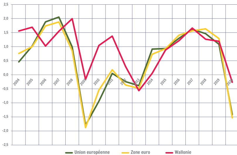
Taux de croissance annuel de l'emploi intérieur. Comparaison Wallonie / Europe (Union européenne : sans le Royaume-Uni)

Entre 2010 et 2020, l'emploi intérieur wallon a augmenté (+0,7 %) à un rythme légèrement supérieur à celui de l'emploi intérieur de l'Union européenne (+0,5 %) et de la zone euro (+0,5 %). Durant cette période, il a crû à un rythme supérieur à l'emploi intérieur français (+0,5 %), à un rythme inférieur que l'emploi intérieur des Pays-Bas (+0,8 %) et à l'emploi intérieur allemand (+0,9 %).