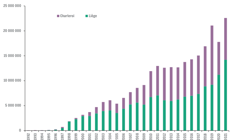
Evolution du transport aérien cumulé à Liège Airport et Charleroi Bruxelles-Sud (en millions de work load unit-wlu)

L'activité dans les aéroports wallons, illustrée par l'unité work load unit, montre une évolution en progression en 2021 avec une progression à Liège Airport (14,2 millions wlu, +27 %) et à Charleroi (8,4 millions wlu, +28 %) après le recul de 2020. Constat qui s'explique par la spécificité de chaque aéroport (le passager à Charleroi et le fret à Liège) et par les répercussions différentes liées à la pandémie en 2020 sur ces divers trafics ; auparavant l'illustration montre un développement de même ampleur dans les deux aéroports.