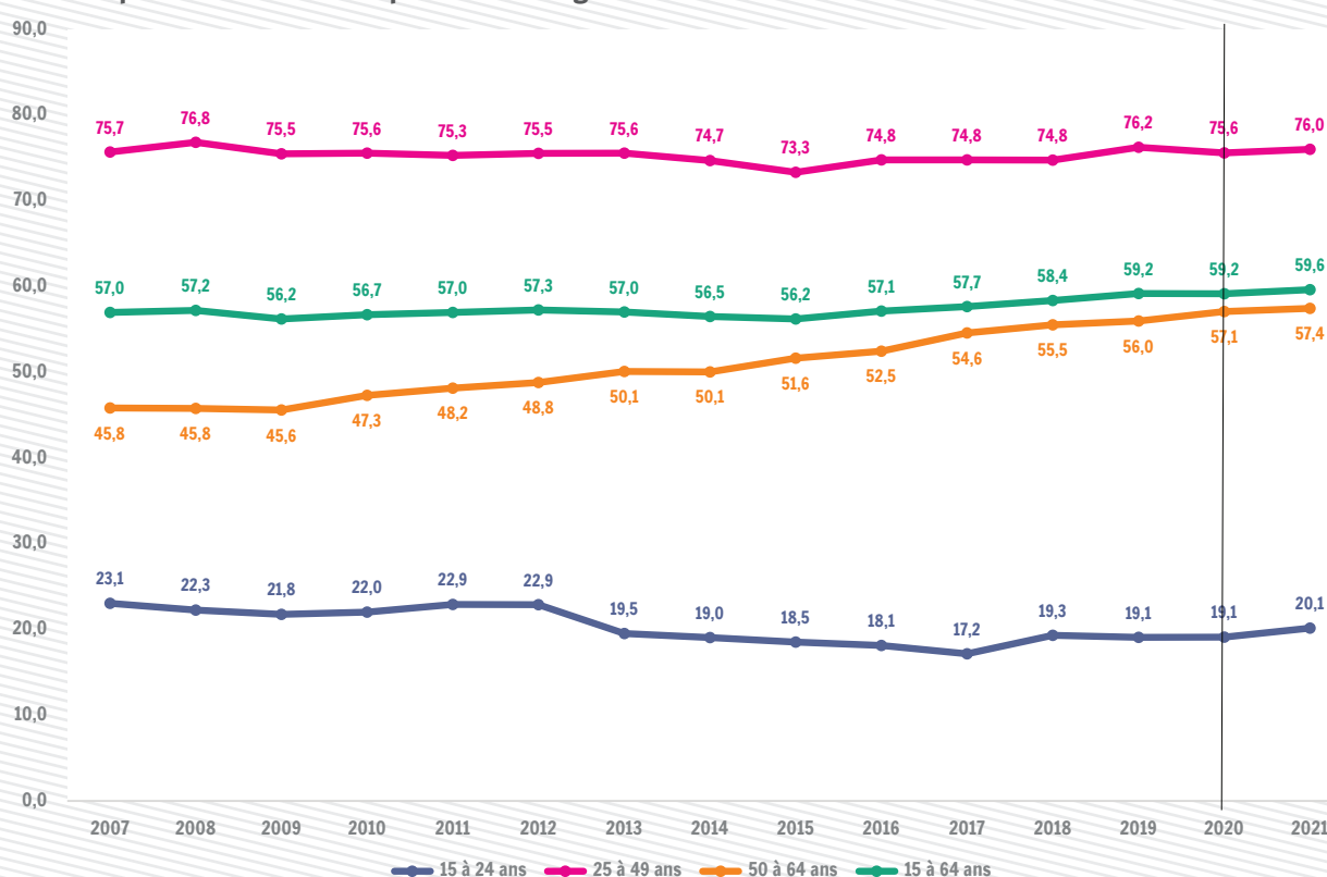
Taux d'emploi BIT des 15-64 ans par tranche d'âge en Wallonie