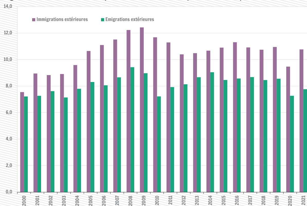
Migrations extérieures en Wallonie pour mille habitants (sans l'ajustement statistique)

Sources : Demobel - Statbel Registre national ; Calculs : IWEPS