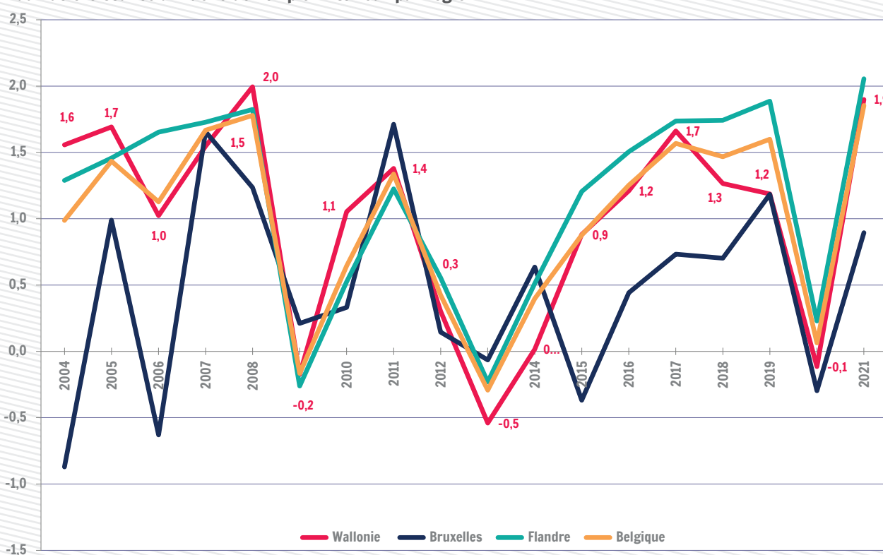
Taux de croissance annuelle de l'emploi intérieur par région