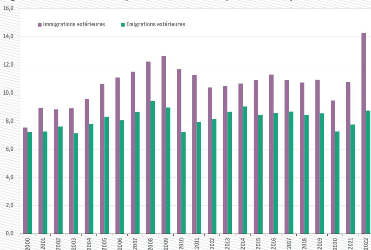
Migrations extérieures en Wallonie pour mille habitants (sans l'ajustement statistique)