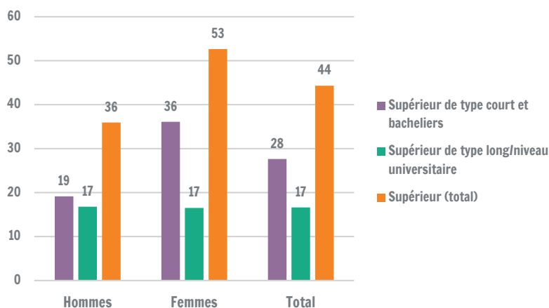
Part de diplômés de l'enseignement supérieur parmi les 30-34 ans selon le type d'enseignement, en Wallonie (2022)

Parmi les 30-34 ans, 28 % sont diplômés de l'enseignement supérieur de type court ou bacheliers et 17 % de l'enseignement supérieur de niveau universitaire. La différence entre hommes et femmes se marque surtout pour l'enseignement supérieur de type court: 36 % des femmes âgées de 30 à 34 ans ont un diplôme de l'enseignement supérieur de type court ou un baccalauréat contre 18 % des hommes. Pour l'enseignement supérieur de niveau universitaire, ces taux s'élèvent à 19 % tant pour les femmes que pour les hommes.