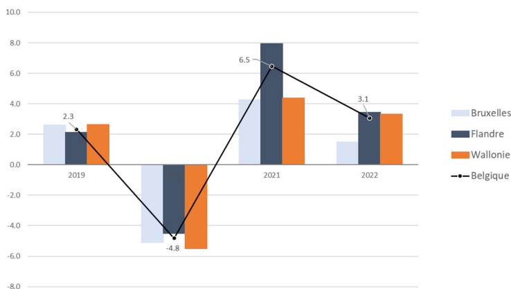
ÉVOLUTION DE L'ACTIVITÉ ÉCONOMIQUE 1 PAR RÉGION (en pourcentage)

Après la reprise vigoureuse de l'activité économique en 2021, la croissance s'est normalisée en 2022, tant en Flandre qu'en Wallonie, avec une progression de respectivement 3,4% et 3,3% dans les deux régions, alors que Bruxelles a enregistré une croissance relativement plus faible de 1,5 %. L'ombre de la crise énergétique a plané sur les différentes branches d'activité, ce qui a contribué au repli de la croissance économique dans les trois régions.