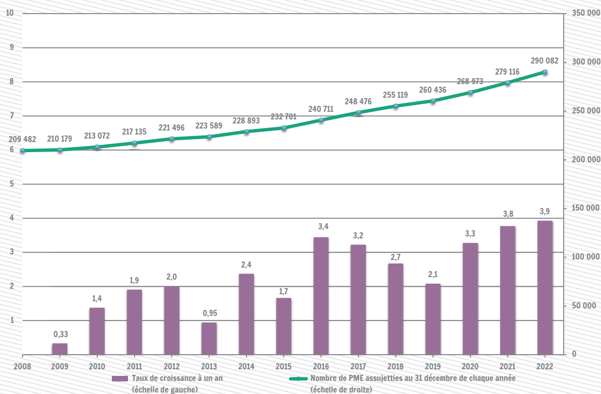
Nombre de PME et variation annuelle 2008-2022

Sources : Direction générale Statistique - Statbel ; Calculs : IWEPS