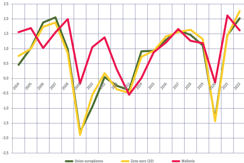
Taux de croissance annuelle de l'emploi intérieur. Comparaison Wallonie / Europe (Union européenne : sans le Royaume-Uni)

Entre 2012 et 2022, l'emploi intérieur wallon a augmenté à un rythme moyen (+0,9 % TCAM) égal à celui de l'emploi intérieur de l'Union européenne (+0,9 %) et de la zone euro (+0,9 %). Durant cette période, il a crû à un rythme moyen inférieur à l'emploi intérieur français (+1,0 %), à celui des Pays-Bas (+1,4 %) et supérieur à celui observé en Allemagne (+0,8 %).