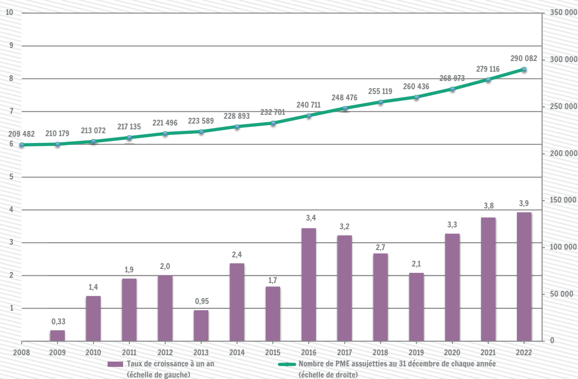
Nombre de PME et variation annuelle 2008-2022

Sources : Direction générale Statistique - Statbel ; Calculs : IWEPS