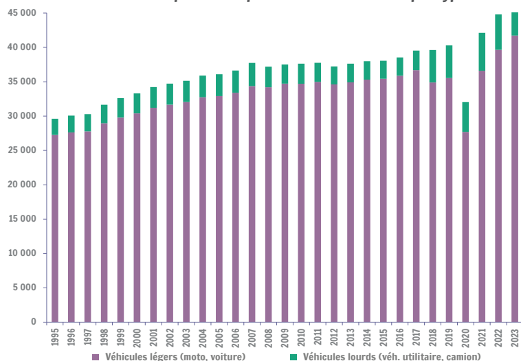
Nombre de véhicules.km parcourus par an (millions de vkm) par type de véhicule

Entre 1995 et 2017 (année de changement méthodologique), la catégorie « véhicules légers » (moto, voiture particulière) progresse de 35 % en termes de véhicules.km et de 20 % entre 2018 et 2023. Elle représente 89 % du trafic en 2023. La catégorie « véhicules lourds » (véhicule utilitaire, camions-tracteurs) augmente de 21 % (période 1995-2017) et de 9 % depuis 2018. Bien que difficile à recenser, il est constaté une progression constante des véhicules utilitaires type « camionnettes » depuis 2014, possible conséquence de l'introduction de la taxe kilométrique pour les camions de plus 3,5 tonnes (dès 2016).