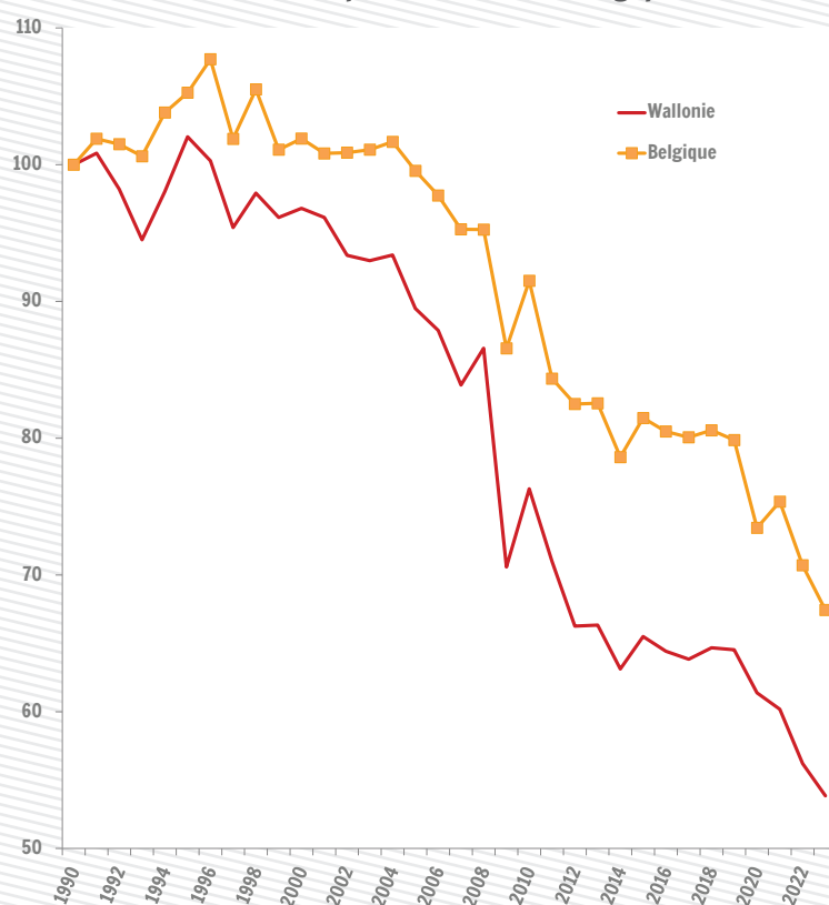
Emissions de gaz à effet de serre (GES) : comparaison Wallonie-Belgique (1990 = 100)