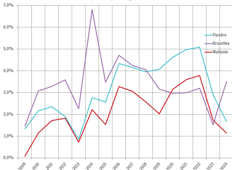
Taux de création nette d'entreprises par région - Évolution 2007-2024

Entre 2007 et 2024, le taux moyen de création nette d'entreprises s'est établi à 1,1 % en Wallonie, 1,7 % en Flandre, et 3,5 % en Région de Bruxelles-Capitale.