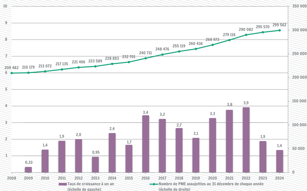
Nombre de PME et variation annuelle 2008-2024

Sources : Direction générale Statistique - Statbel ; Calculs : IWEPS