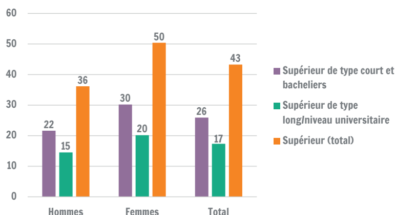
Part de diplômés de l'enseignement supérieur parmi les 25-34 ans selon le type d'enseignement, en Wallonie (2024)

Parmi les 25-34 ans, 26 % sont diplômés de l'enseignement supérieur de type court ou de bacheliers de l'enseignement supérieur de type long et 17 % de l'enseignement supérieur de niveau universitaire (masters et équivalents). La différence entre hommes et femmes se marque surtout pour l'enseignement supérieur de type court: 30 % des femmes âgées de 25 à 34 ans ont un diplôme de l'enseignement supérieur de type court ou un baccalauréat contre 22 % des hommes. Pour l'enseignement supérieur de niveau universitaire, ces taux s'élèvent à 15 % pour les hommes et 20 % pour les femmes.