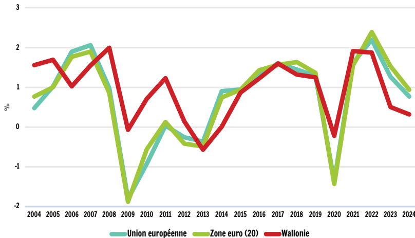
Taux de croissance annuelle de l'emploi intérieur. Comparaison Wallonie / Europe (Union européenne : sans le Royaume-Uni)

Entre 2014 et 2024, l'emploi intérieur wallon a augmenté à un rythme moyen (+1,1 % TCAM) comparable à celui de l'emploi intérieur de l'Union européenne (+1,1 %) et de la zone euro (+1,2 %). Durant cette période, il a crû à un rythme moyen égal à celui de l'emploi intérieur français (+1,1 %), supérieur à celui de l'emploi intérieur allemand (+0,7 %) et inférieur à celui de l'emploi intérieur néerlandais (+1,7 %). L'augmentation de l'emploi intérieur wallon en 2024 (+0,3 %) est inférieure à celle de l'Union européenne (+0,8 %) et à celle de la zone euro (+0,9 %). L'emploi a augmenté moins fort que chez nos voisins néerlandais (+1,1 %) et français (+0,8 %) mais plus vite qu'en Allemagne (+0,1 %).